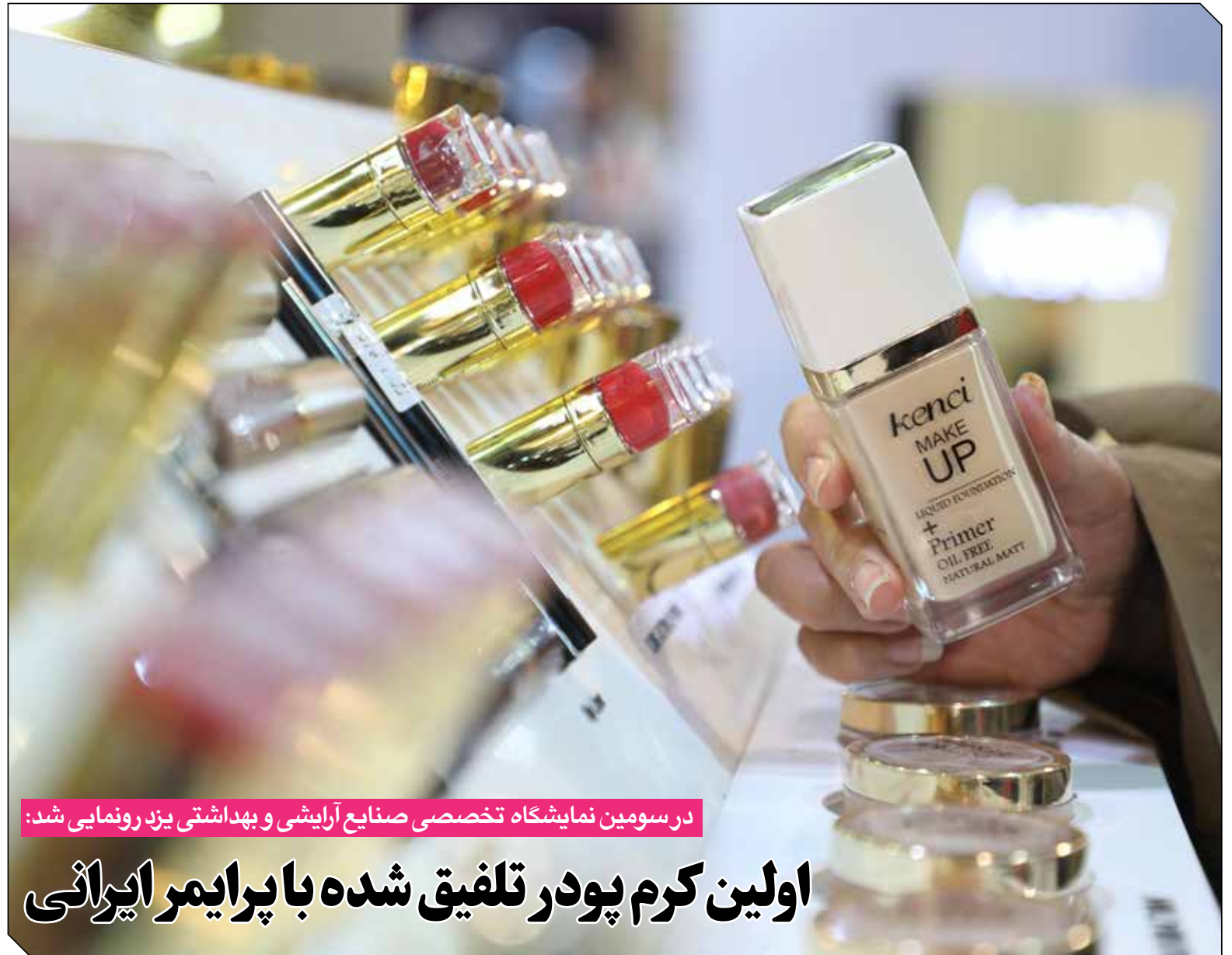
در سومین نمایشگاه تخصصی صنایع آرایشی و بهداشتی یزد رونمایی شد:

پنج‌شنبه ۶ بهمن ۱۴۰۱ = ۲۶ ژانویه ۲۰۲۳ = ۴ رجب ۱۴۴۴ = سال هفتم = شماره ۱۵۲ = ۸ صفحه