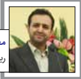
محمد کاظم صدیقیان رییس سازمان صنعت، معدن و تجارت استان یزد

خوشبختانه سومین نمایشگاه صنعت آرایشی و بهداشتی با استقبال بسیار خوبی روبرو شد. چنین رویدادهایی بهترین بستر برای معرفی توانمندی های داخلی است و نقش مهمی در فرهنگ سازی و افزایش آگاهی دارد.