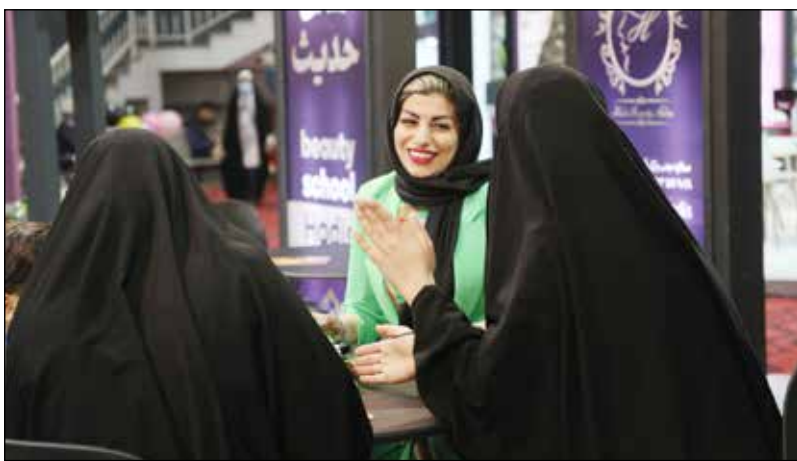
زیبایی‌شناسی در این حجم از خدمات و گستردگی در ۶ طبقه برای اولین بار در ایران انجام شده و نمایشگاه فرصت بسیار خوبی را برای معرفی مجموعه در اختیارمان قرار داد.

جدید و فوق حرفه‌ای است که بهترین ابزار مراقبتی مو و درمانی به شمار می‌رود که با تولید بخار و باد سرد، گرم و نور درمانی همزمان استفاده از سه نوع نور آبی، قرمز و سبز (موی آسیب دیده، موی چرب، موی معمولی) برای درمان موی سر، آبرسانی و اکسیژن‌رسانی مو انجام می‌شود. به گفته او، اسکالپ سر خدمت جدید و بسیار تاثیرگذار در این مجموعه است. در واقع هرچقدر که پاکسازی پوست شادابی پوست را در پی دارد اسکالپ موی سر هم ریزش موی شدید، چربی بالای پوست سر و شوره سر را برطرف می‌کند. او عنوان می‌کند: سومین نمایشگاه تخصصی صنایع آرایشی و بهداشتی و زیبایی با استقبال قابل توجهی روبه رو بود، و موفق شدیم این مجموعه را به افراد بسیار زیادی معرفی کنیم که بسیار رضایت بخش بوده است. در واقع دپارتمان